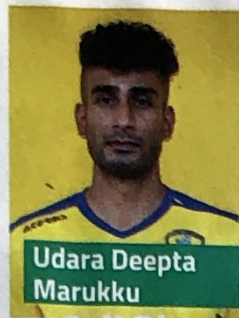
Udara Deepta Marukku